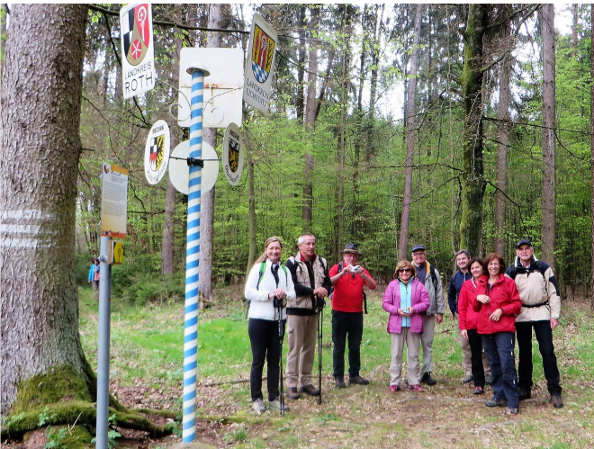
Am 3 Länder Eck (07.02.2018,)

Die Route folgt weiter dem Wallfahrerweg 📍 am Hangwald entlang, dann abwärts. Zuerst durch ein idyllisches Trockental, dann entlang der steil abfallenden Felspartien der aufgelassenen Steinbrüche im