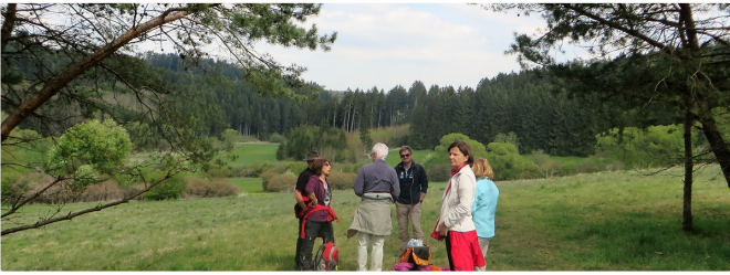
Talblick (07.02.2018,)

In der Talaue folgst du dem Wallfahrerweg 📍 schließlich wieder hinauf und auf Wiesenwegen über die Höhe, an der Mariengrotte vorbei und am Ortsrand von Herrnsberg mit Kirche aus dem 16. Jahrhundert entlang, bis zum 3-Länder-Eck .