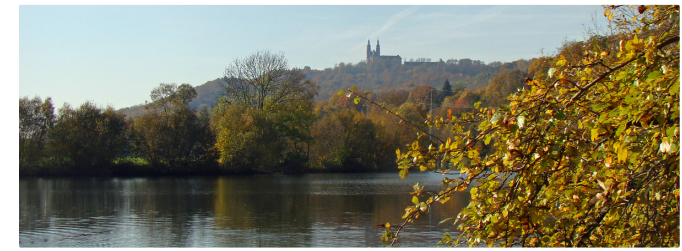
Der Main – Kloster Banz im Hintergrund

Nun dem Radzeichen hinterher, links in den Mainwiesenweg (Sackgasse) und vor dir liegt der markante Staffelberg – das Wahrzeichen Frankens –, die Basilika des Wallfahrtsortes Vierzehnheiligen und das berühmte Kloster Banz .