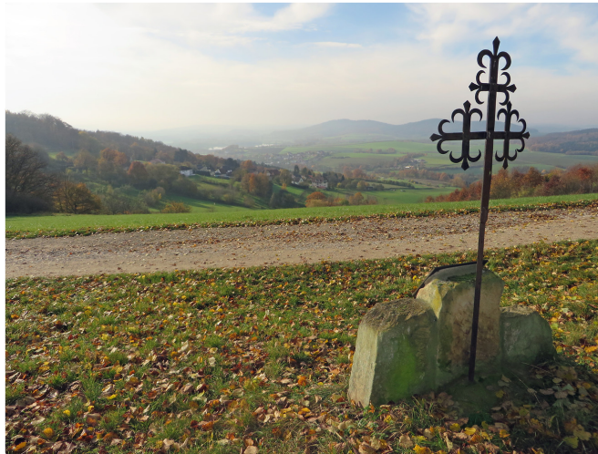
Aussicht Richtung Unnersdorf – Herbststimmung