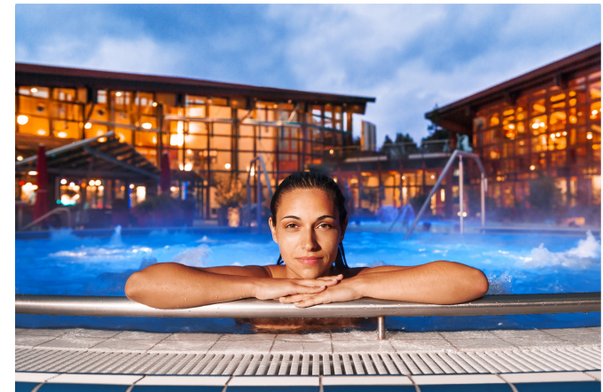
Obermain Therme Whirlpool – Nur wenige Meter vom Bahnhof Bad Staffelstein entfernt liegt die beliebte Obermain Therme.