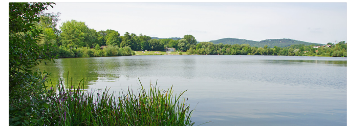
Badesee Bad Staffelstein – Blick Richtung Strandbad

Der mit der "Blauen Flagge" ausgezeichnete Badesee ist von Mitte Mai bis Ende Oktober täglich von 9.00-20.00 Uhr geöffnet.