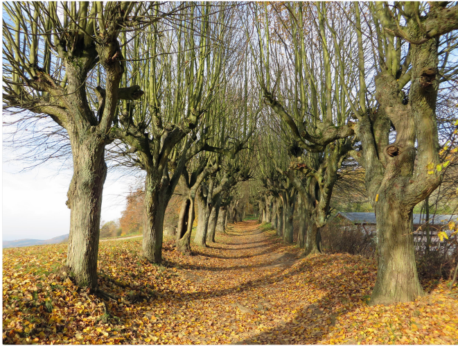
Kreuzweg am Kloster Banz – Herbststimmung

Anschließend erreichst du das berühmte Kloster Banz .