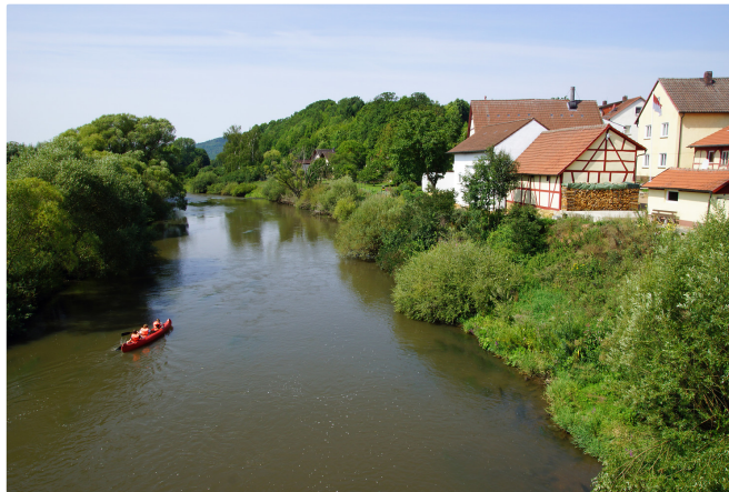
Main bei Unnersdorf