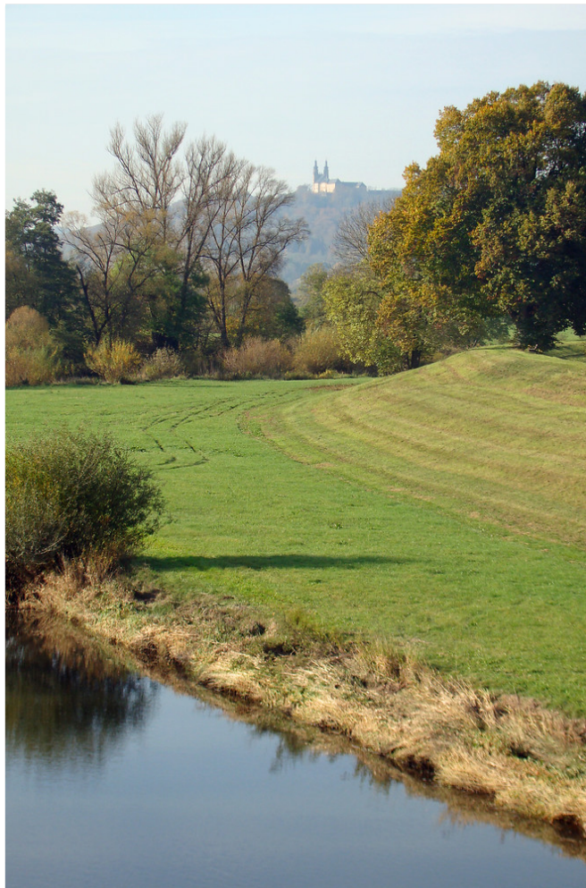
Main in Lichtenfels

Am Bach entlang führt die 4 nach Kösten hinein und biegt nach links ab. Du hältst dich stattdessen rechts, querst erneut den Bachlauf und folgst der Schloss-Banz-Straße noch etwa 100 m aufwärts.