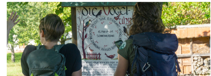
2 Wanderinnen am Infoschild (27.09.2020,)

Als Abstecher geht es zwischendrin dem Wegweiser nach auf den Poppberg .