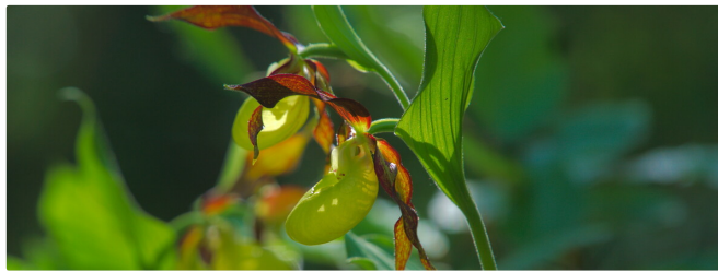
Besondere Pflanze - die Orchidee (24.05.2020,)