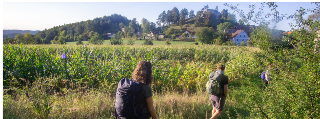
Wanderinnen auf Tour (27.09.2020,)

Auf dem markierten Weg führt die Route am Kronberg vorbei, schließlich bergab – mit Blick auf Burg Lichtenegg : dem letzten Abstecher der Tour.